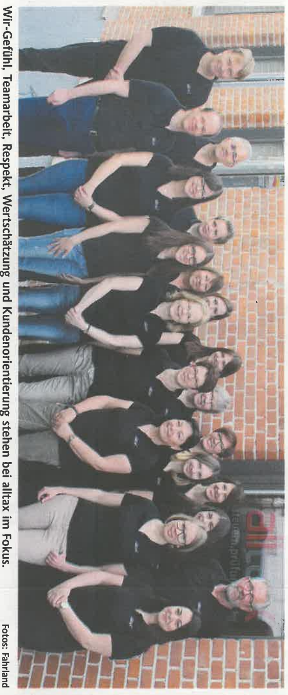
Wir-Gefühl, Teamarbeit, Respekt, Wertschätzung und Kundenorientierung stehen bei alltax im Fokus.

Die alltax Gmbh, Wirtschaftsprüfungs- und Steuerberatungsgesellschaft, mit Standorten in Reutlingen und Sulz sowie einem Beratungsbüro in Obernheim berät, prüft und vertritt seit mehr als 25 Jahren sowohl Unternehmen als auch Privatpersonen in allen Angelegenheiten rund um Steuern, Prüfung und Recht. 1989 als UPG-Treuhand Steuerberatungsgesellschaft mbH gegründet, erfolgte 1992 die Umfirmierung in die alltax